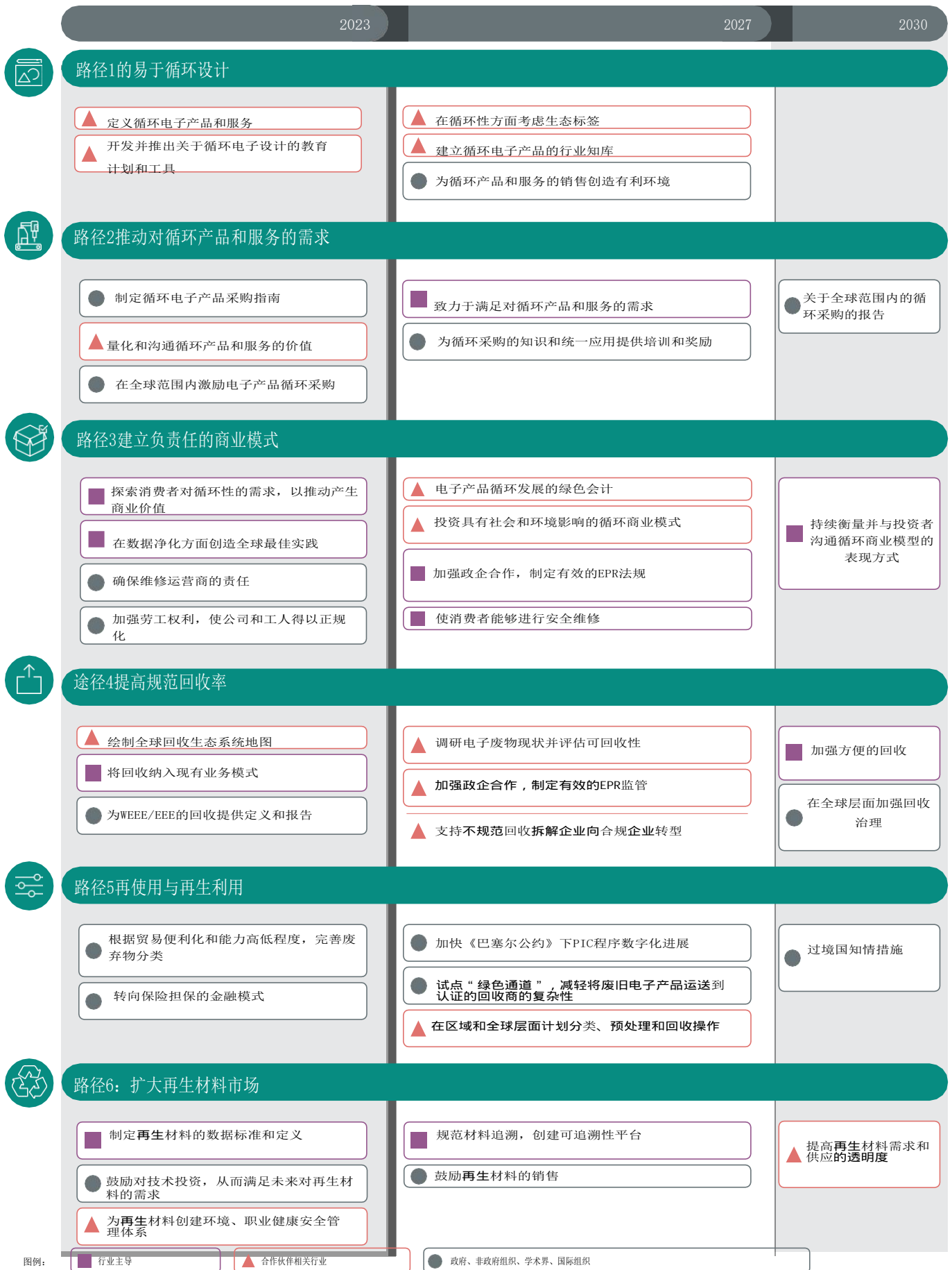
图2: 探索路线图中的六个路径